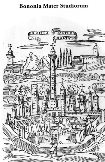
Veduta prospettica di Bologna nella seconda metà del sec. XVI

Ha pubblicato vari saggi sulla musica nel Veneto e a Vicenza, studi su aspetti e momenti della musica per tastiera dal '300 all'800, in particolare sull'ambiente bolognese e l'attività musicale del Conservatorio, e i volumi Le Tastiere, storia estetica e prassi , Rugginenti Editore; Luigi Boccherini e la cultura musicale del Classicismo , Edizioni dell'Erba, Fucecchio. Ha collaborato con varie riviste, attualmente con Erba d'Arno in particolare per le tematiche paesistico-culturali.